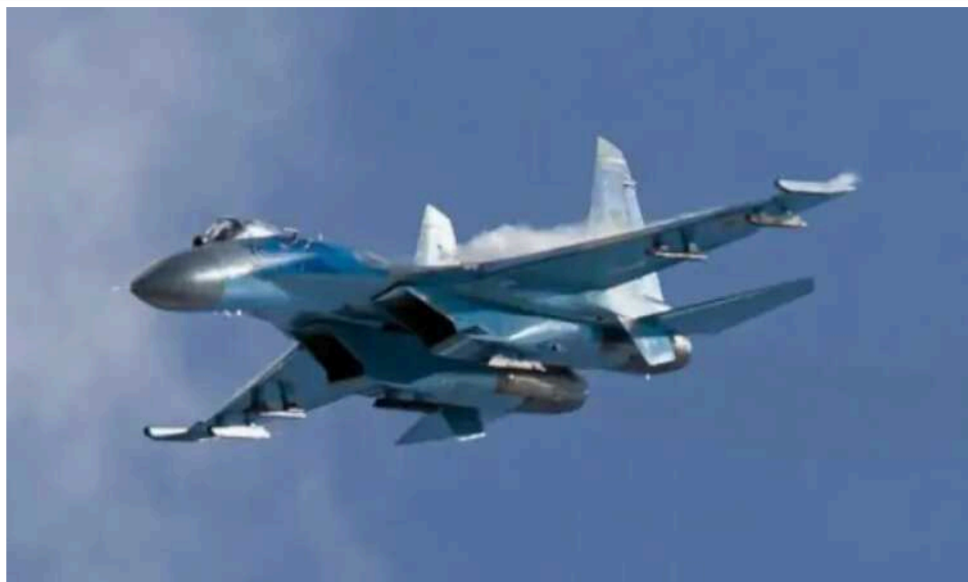
Forbes: Росія може скидати сотню керованих авіабомб на день: чим відповідає Україна

Українські захисники для завдання ударів по позиціях противника застосовують французькі авіаційні бомби AASM Hammer. Серед останніх знищених об'єктів – російський склад у Козачих Лагерях.