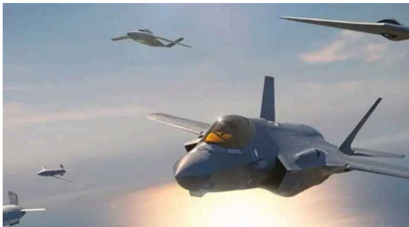
В РФ описали сценарій війни із Заходом: удари із землі, повітря та моря

В умовах повномасштабного конфлікту із застосуванням так званих військових підрозділів нового типу авіація, як найманевреніший і найадаптованіший вид військ, має першою вступати в бій.