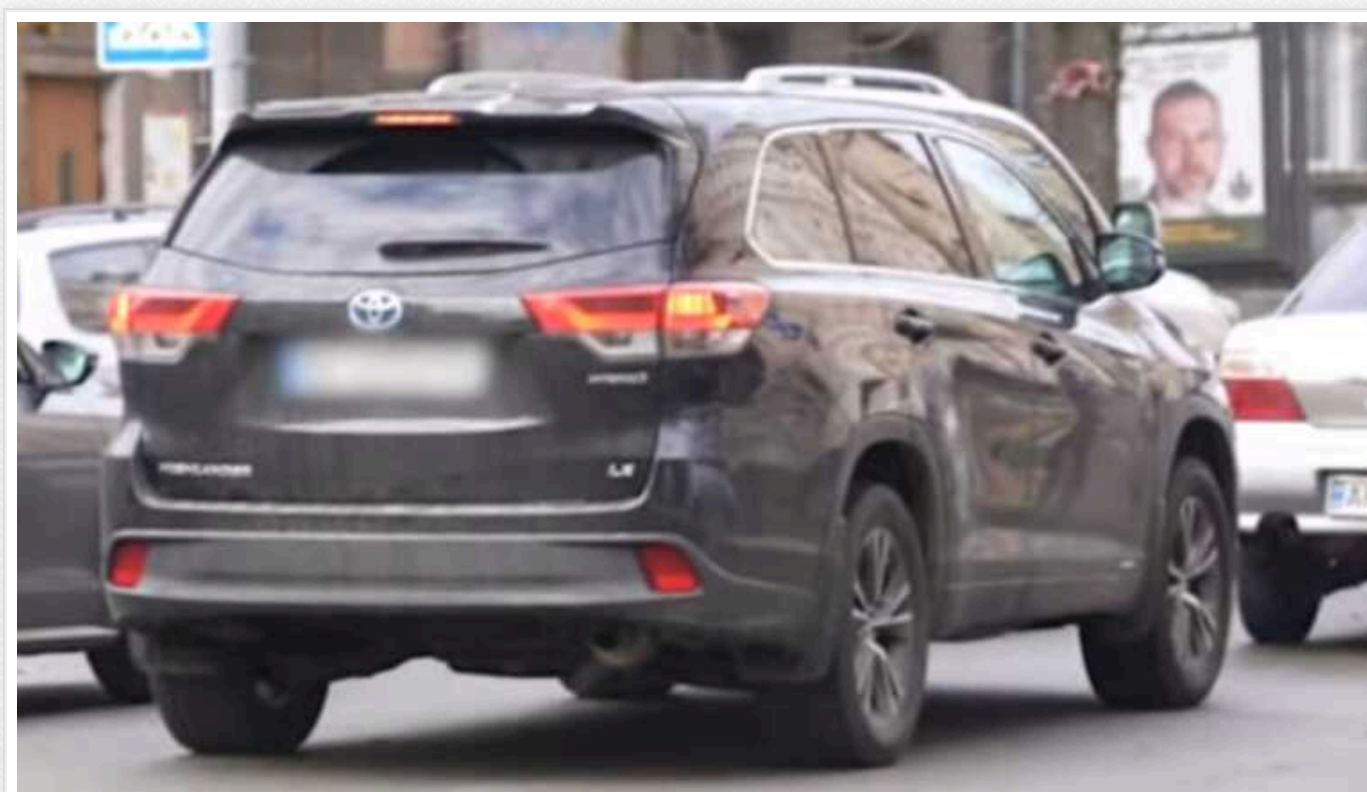
Журналисти вивчили декларації депутатів: елітні автівки, бізнес у Дубаї та пентхаус біля моря

Народний депутат Артем Дмитрук, який знімає в пропагандистських роликках Анатолія Шарія, заявляє, що не має власного майна, водночас їздить на люксових авто і проживає в елітних одеських житлових комплексах.