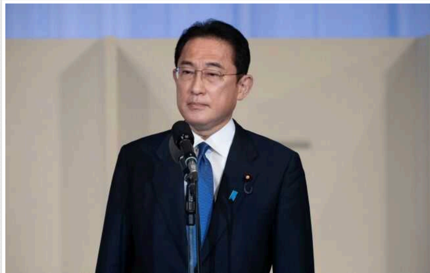
Японський прем'єр може відвідати Північну Корею та зустрітися з Кім Чен Ином

Прем'єр-міністр Японії Фуміо Кісида висловив бажання провести зустріч із Кім Чен Ином у Північній Кореї для вирішення проблеми викрадених японців.