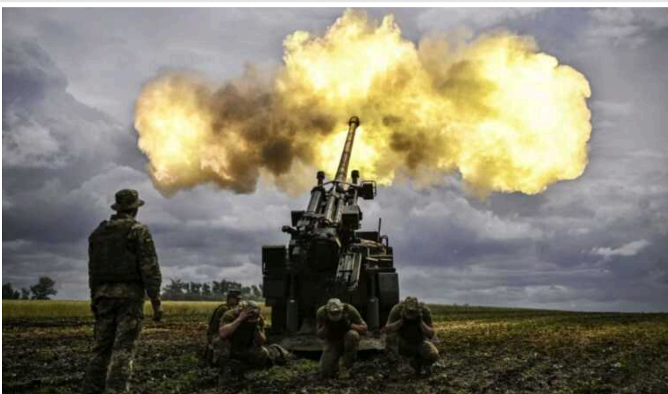
Ситуація на фронті: за добу відбулося 74 боєзіткнення

Протягом минулої доби відбулося 74 бойових зіткнення. Загалом ворог завдав 5 ракетних та 66 авіаційних ударів, здійснив 108 обстрілів з реактивних систем залпового вогню по позиціях наших військ та населених пунктах.