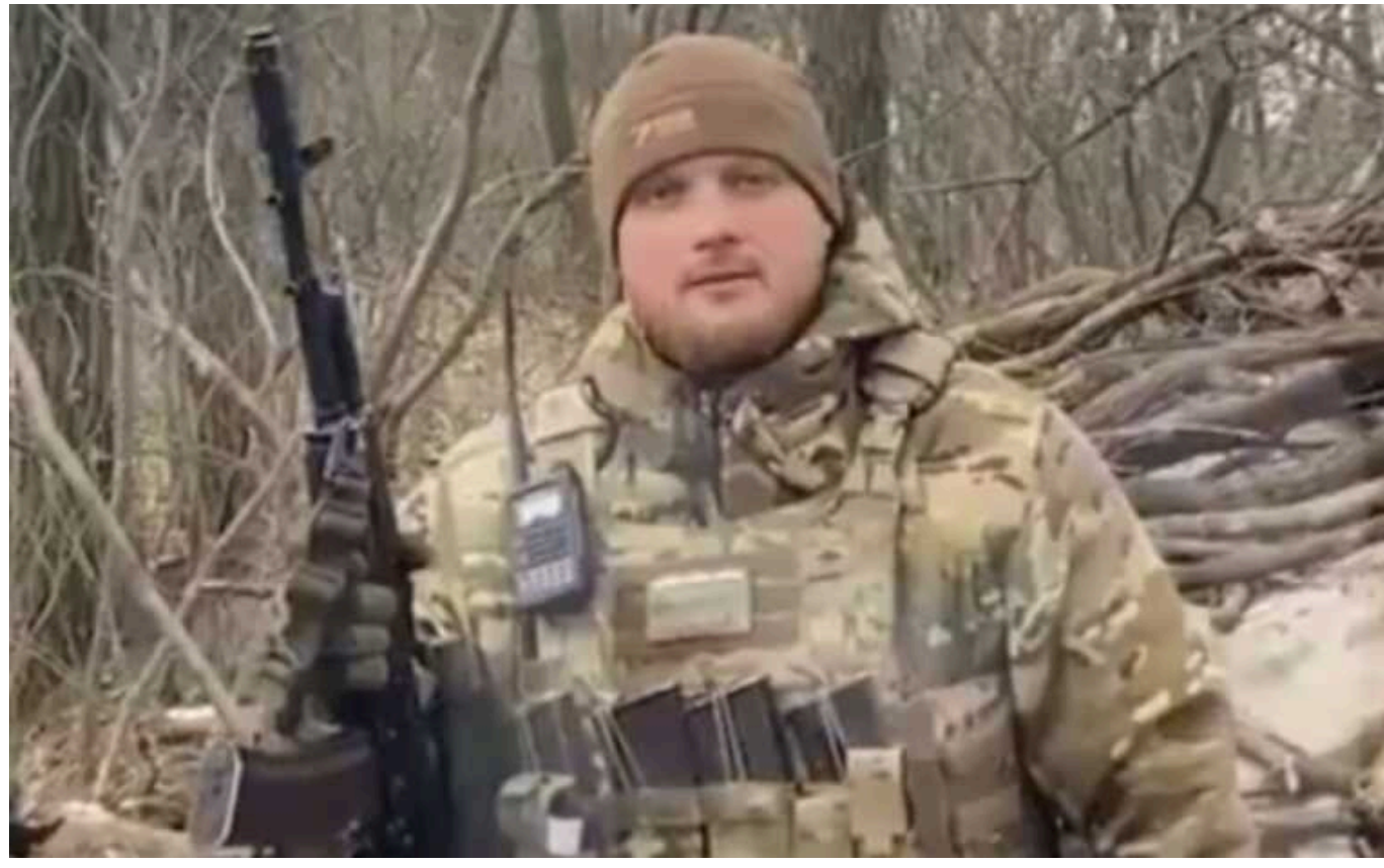
ЗСУ ліквідували начальника розвідки ворожої бригади «Еспаньола»

Російський неонацист В'ячеслав Субботін обіцяв своїм дітям вухо українця.