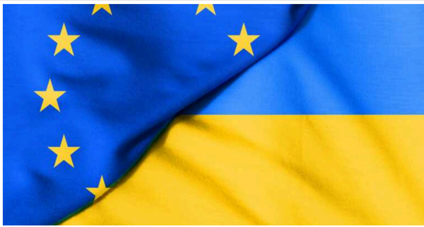
Євросоюз зупинить вільну торгівлю з Україною? Економіст пояснив, які обмеження можуть запровадити

Зона вільної торгівлі (ЗВТ) України та Європейського Союзу (ЄС) за фактом не закінчиться влітку 2024 року. Однак на даний момент стоїть питання часткового повернення квот та мит на експорт низки "чутливих" товарів з України до Європи. Зокрема, це яйця, курятина та цукор.