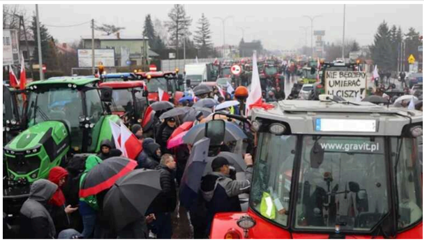
Посол Зварич емоційно звернувся до польських фермерів та озвучив втрати від блокади

Україна вже втратила від польської блокади кордону 500 млн доларів, або близько 19 млрд грн. Це завдає серйозного удару не тільки українській економіці, а й обороні країни, а значить також загрожує і безпеці Польщі. Така ситуація вигідна виключно країну-агресору Росії, а тому настав час польським фермерам перестати піддаватися пропаганді та нарешті розблокувати кордон.