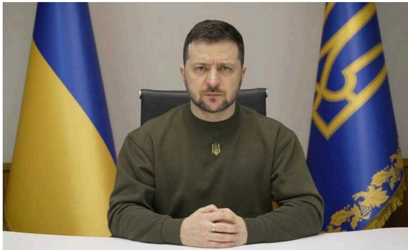
Розуміємо, які документи на столі у ворога, який у нього черговий задум, – Зеленський

Президент України Володимир Зеленський розповів про свої наради з військовими та розвідниками. Зокрема, з доповіді голови Служби зовнішньої розвідки України Олександра Литвиненка стало відомо про плани країни-агресора Росії.