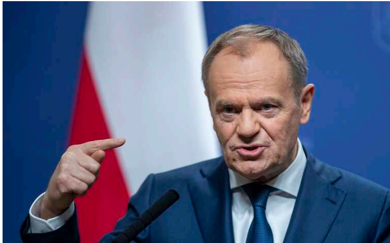
Польща вимагатиме від Євросоюзу заборонити зерно та продукти з РФ

Польща закликає Європейську комісію (ЄС) запровадити повну заборону на імпорту агропродукції та продуктів харчування з Росії та Білорусі. Польський уряд вважає, що найбільш ефективним рішенням у цьому питанні стане запровадження саме загальноєвропейського ембарго, а не заборони на рівні окремих країн.