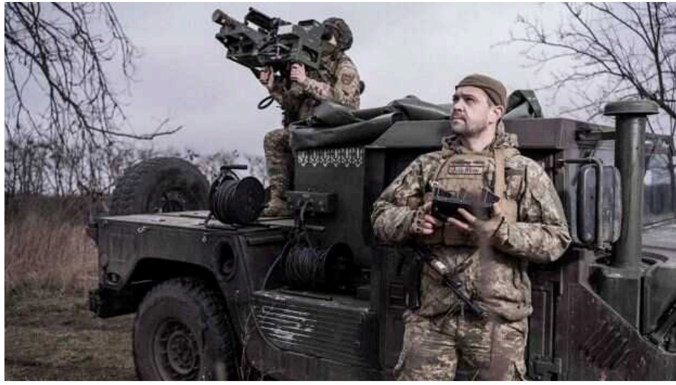
Ситуація на фронті: ворог завдав 5 ракетних і 44 авіаційні удари

Українські захисники відбили більше 20 атак російських окупантів під Авдіївкою і вдарили по низці районів зосередження ворожих солдатів.