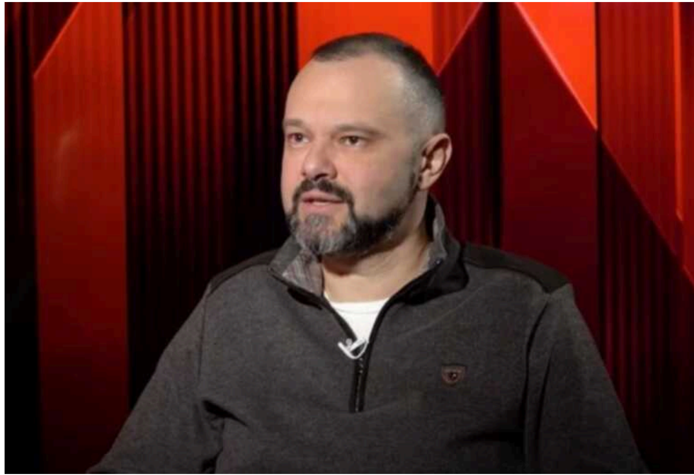
Телеведучого каналів Медведчука судитимуть за виправдовування російської агресії

Київська міська прокуратура скерувала до суду обвинувальний акт щодо колишнього політика та телеведучого забороненого в Україні телеканалу NewsOne Максима Гольдарба. Йому інкримінують два злочини: колабораційна діяльність і виправдовування війни Росії проти України.