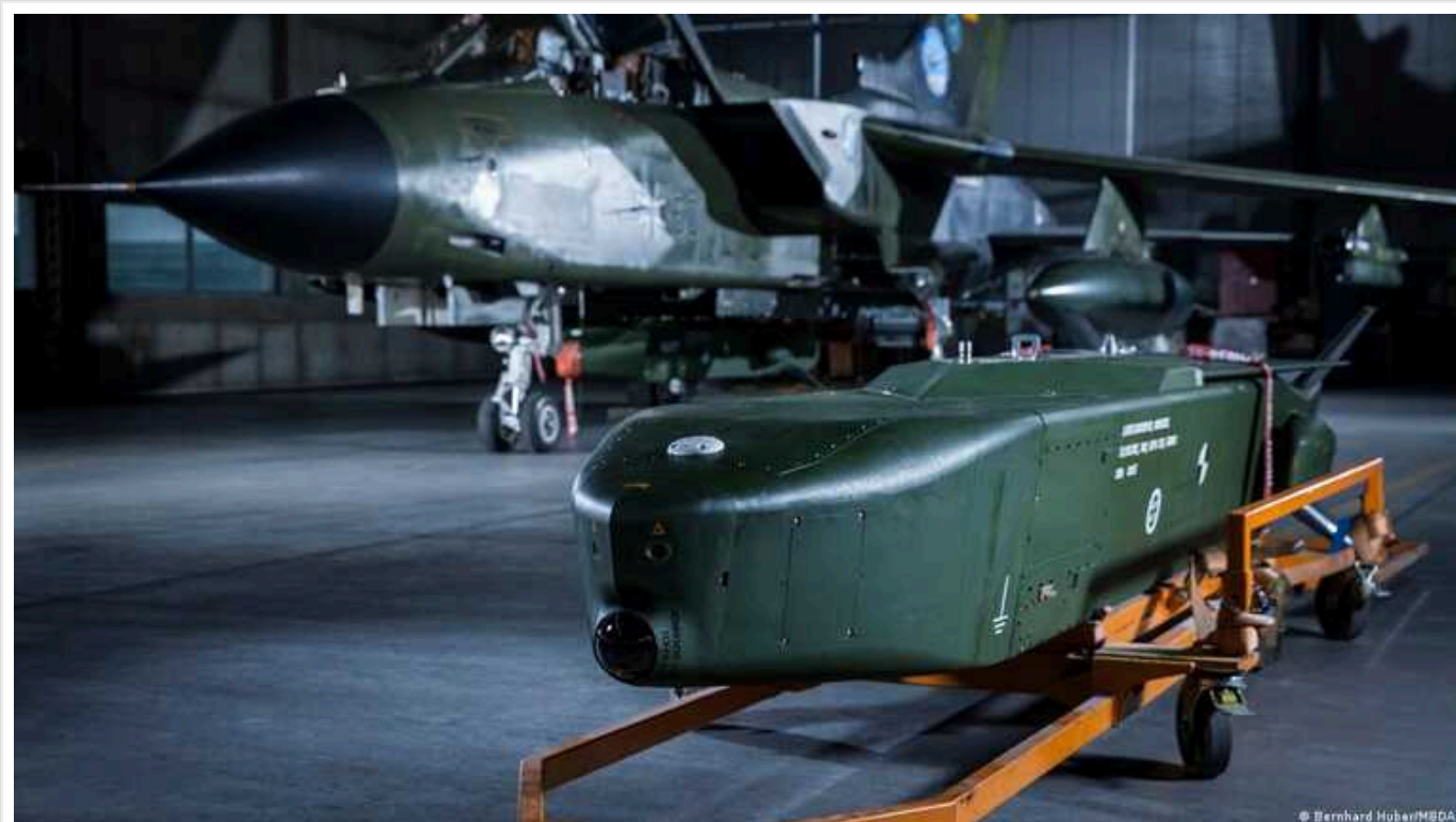
NYT сумнівається, що Taurus, у разі їх надання Берліном Києву, матимуть якесь вирішальне значення для ЗСУ

«Далеко не очевидно, що навіть якби Німеччина надала Україні ракети «Тaurus», як закликав президент Володимир Зеленський, це мало б вирішальне значення у конфлікті», – ідеться в публікації.