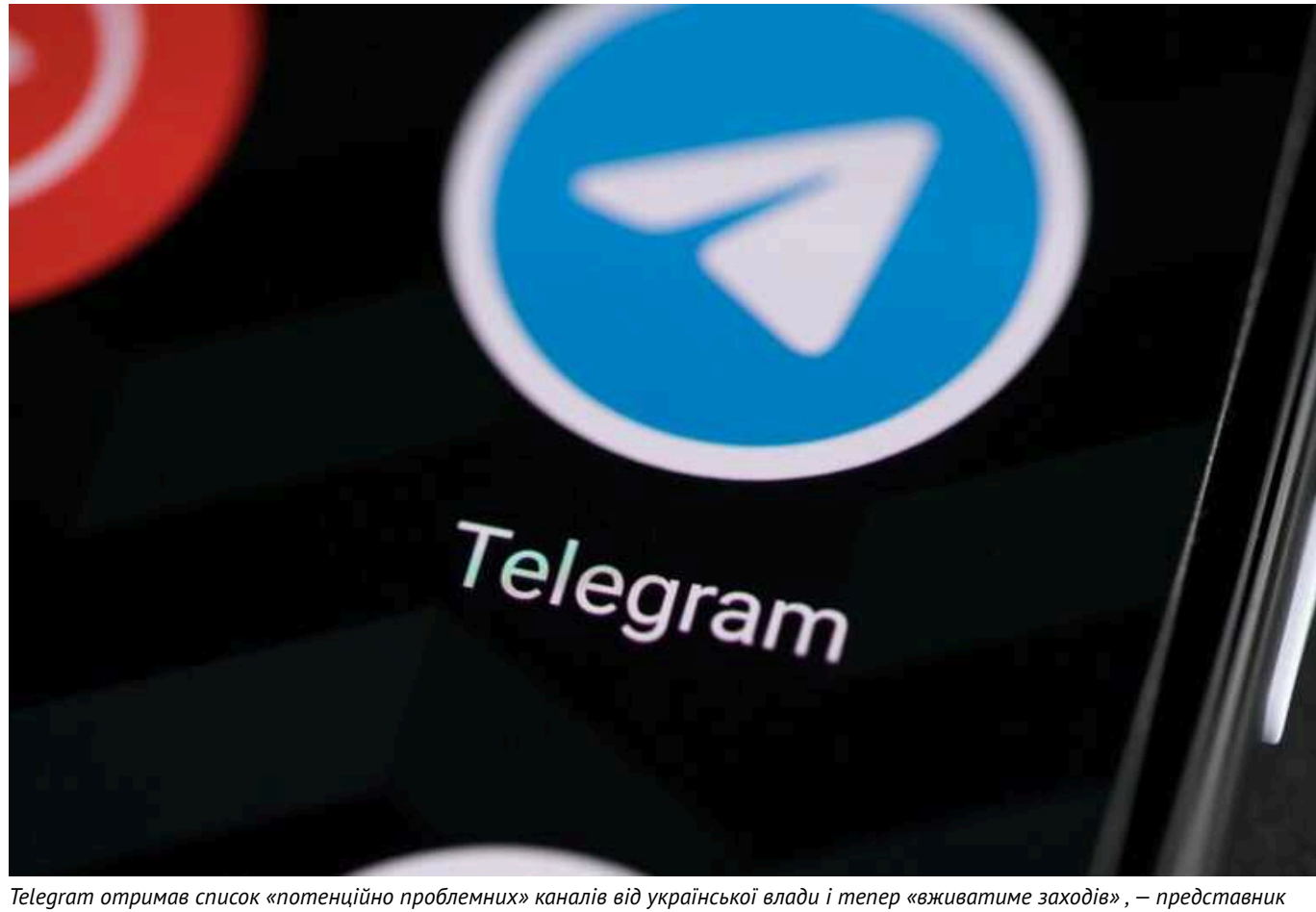
Telegram отримав список «потенційно проблемних» каналів від української влади і тепер «вживатиме заходів», — представник

Про це повідомив представник Telegram Ремі Вонг.