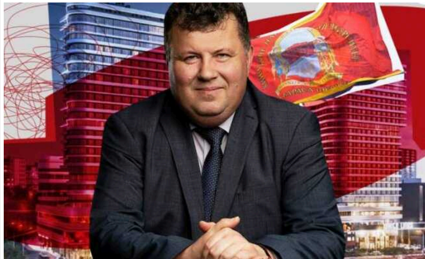
Ректор університету Шевченка став власником майна в елітній новобудові