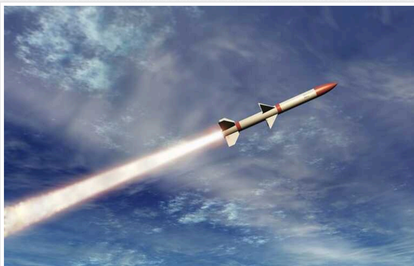
Росія спробувала атакувати регіональні енергооб'єкти в Україні, - розвідка Британії

Протягом лютого 2024 року російські війська здійснювали атаки на українську інфраструктуру, зокрема її енергетичну. Для цього окупанти використовували безпілотники односторонньої дії (OWA-UAV, які РФ розробляє на базі іранських моделей дронів типу "Shahed").