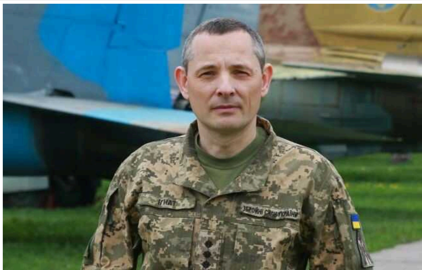
Кілька груп Су-34 і Су-35 готують до нанесення ударів, - ЗСУ

Після значних втрат літаків ворог втік з повітряного простору, але зараз починає відновлювати свою активність. Про це сказав речник Командування Повітряних сил ЗСУ Юрій Ігнат в ефірі телемарафону.