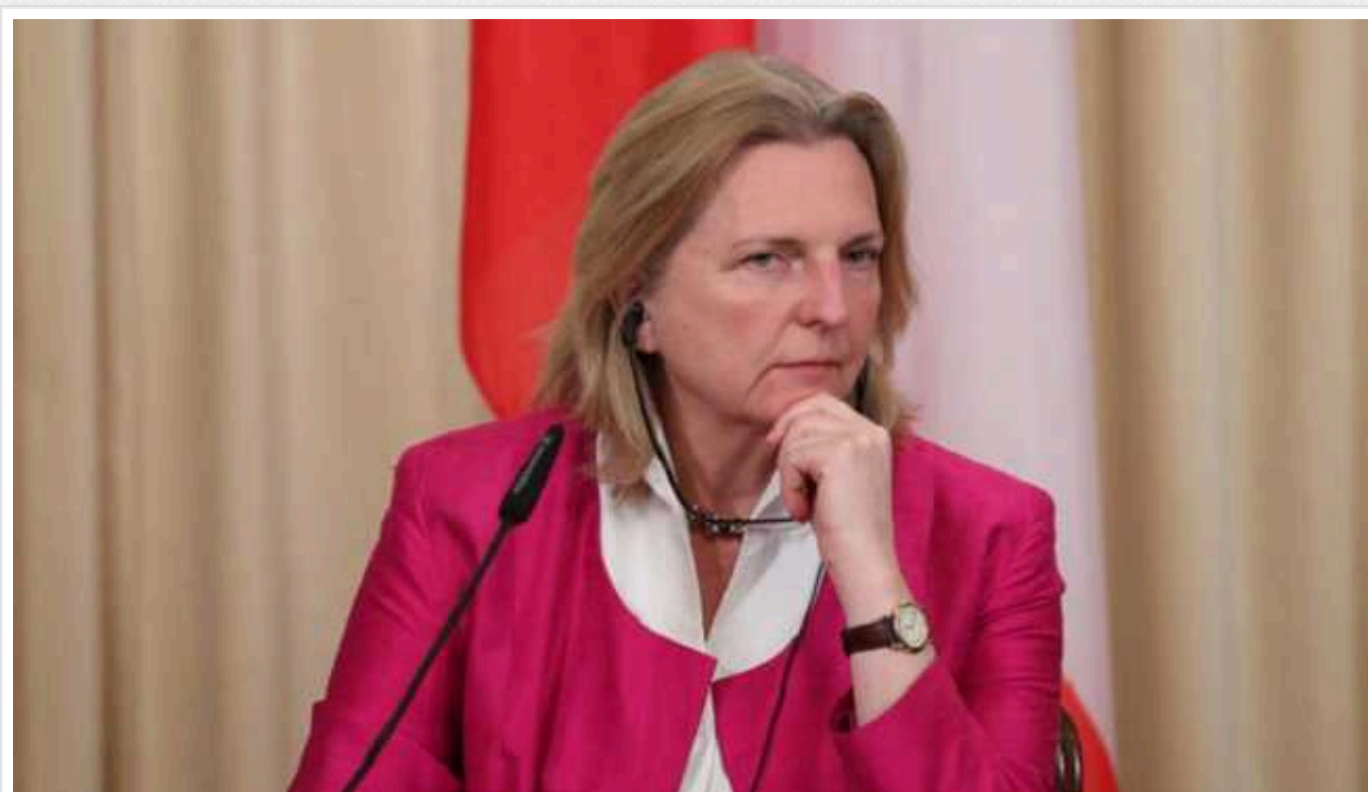
Ексглава МЗС Австрії, яка танцювала з Путіним, перебралася до Росії і назвала її "по-справжньому вільною"

Колишня міністерка закордонних справ Австрії Карін Кнайсль заявила, що остаточно переїхала жити до Росії. Водночас громадянство політикиня, яка запам'яталася танцем із диктатором Володимиром Путіним, змінювати не буде.