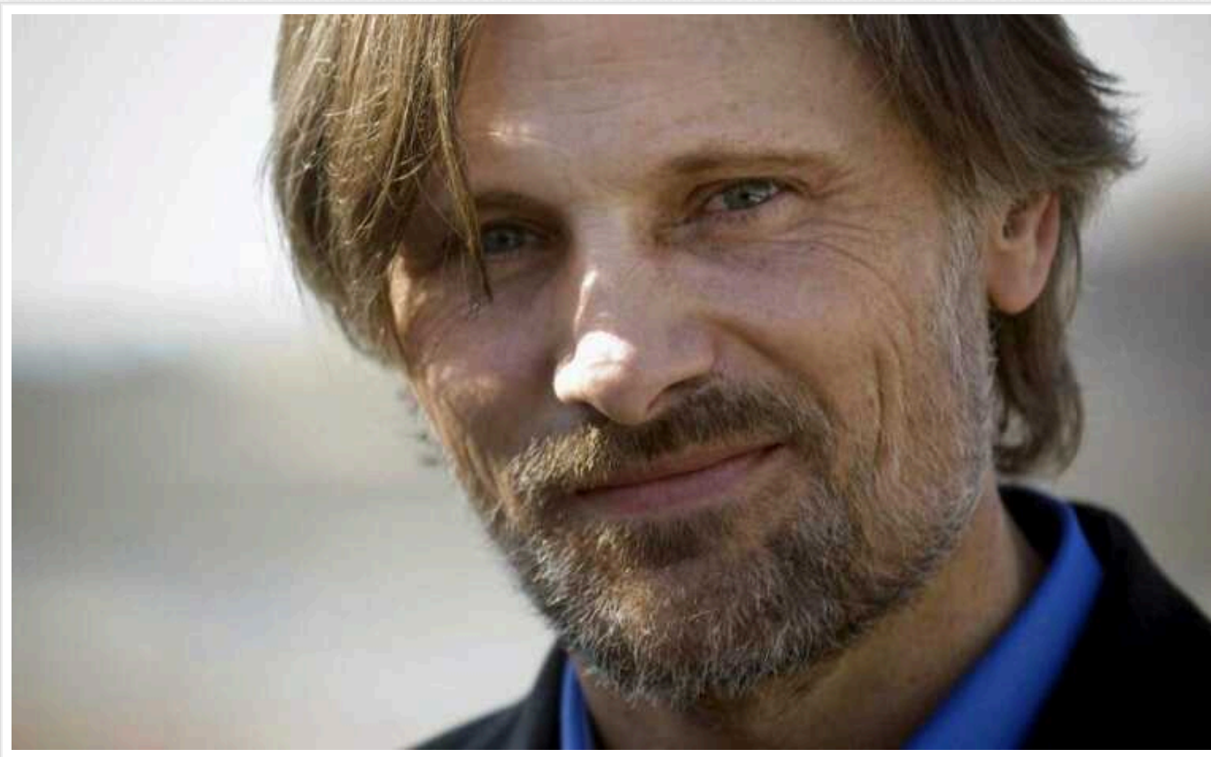
Зірка "Володаря пернів" Вігго Мортенсен назвав Путіна варваром і заявив про підтримку України

Актор Вігго Мортенсен, зірка "Володаря пернів", з'явився на червоній доріжці кінофестивалю в Глазго у чорній футболці з українським тризубом. Знаменитість також заявив про свою підтримку України й розкритикував російську агресію.