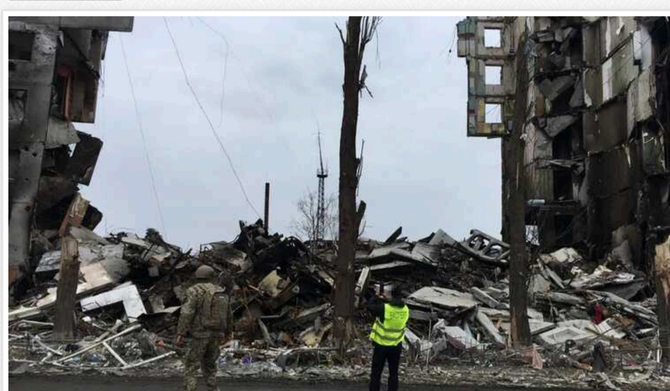
СБУ повідомила про підозру двом російським генералам: командували авіаударами по багатопверхівках на Київщині у 2022

СБУ повідомила про підозру російським генералам, які причетні до воєнних злочинів. Злочинцями командували авіаударами по багатопверхівках під час боїв за столицю.