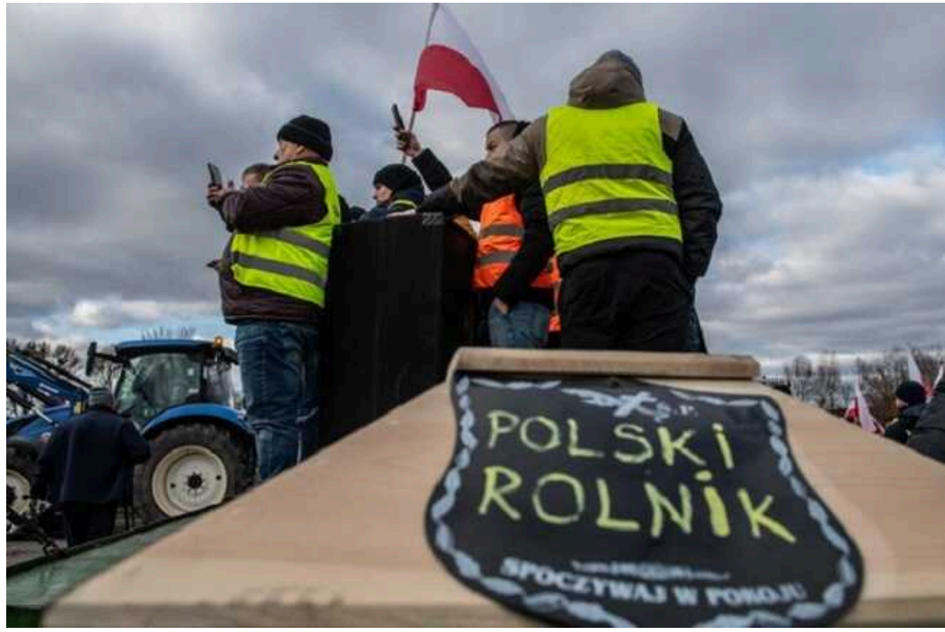
Блокада україно-польського кордону: Польща висунула ультиматум Єврокомісії

Польща, на тлі протестів фермерів та блокади кордонів (насамперед українського), розпочала неформальні переговори з головою Європейської комісії (ЕК) Урсулою фон дер Ляєн. При цьому поляки вже поставили ультиматум: якщо ЕК не погодиться на польські вимоги, влада країни погрожує запроваджувати односторонні заборони та не деблокувати кордони на державному рівні.