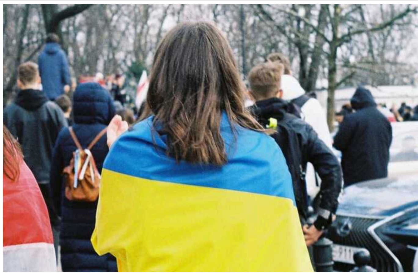
У Польщі розповіли, як оформити допомогу українським біженцям з інвалідністю

Фінансова підтримка надається незалежно від доходу, одержуваного у зв'язку з інвалідністю.