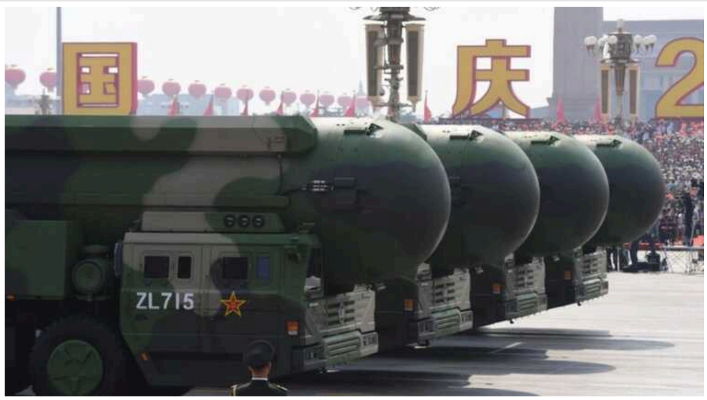
Пентагон: Ядерна та космічна програми Китаю розвиваються надто швидко

За даними Міноборони США, Китай за останній рік збільшив свій ядерний арсенал на 100 боєголовок. А до 2035 року ракетні війська КНР матимуть 1500 ядерних боєголовок.