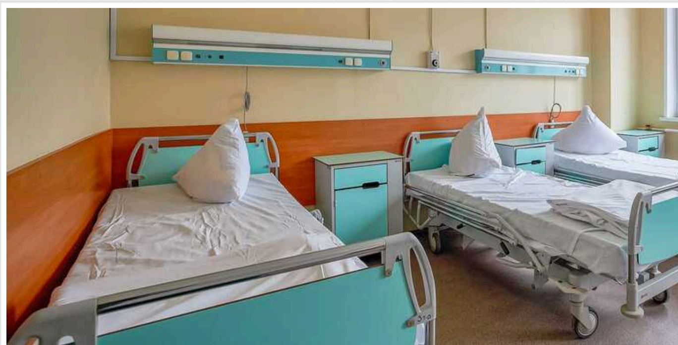
За фактом смерті двох дітей в медичних закладах Одеси поліцейські розпочали кримінальні провадження

Одна з трагічних подій сталася в одеському пологовому будинку, інша – у дитячій клінічній лікарні.