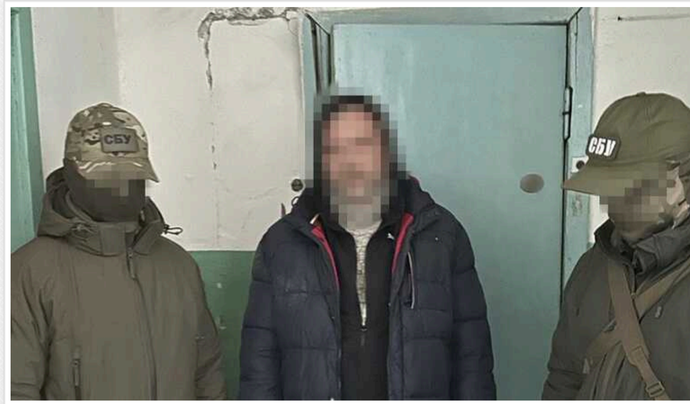
СБУ затримала у Дніпрі зрадника: допомагав окупантам виявляти радіолокаційні станції ЗСУ, щоб «обійти» українську ППО

Контррозвідка Служби безпеки затримала у Дніпрі ще одного агента воєнної розвідки РФ. Зловмисник розвідував місця базування систем ППО та логістичні маршрути Сил оборони на території регіону.