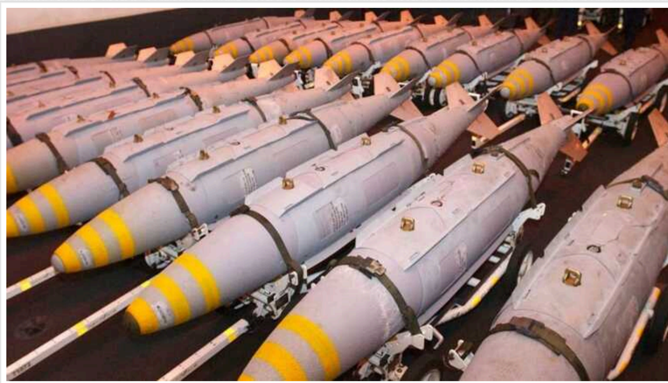
Жодне укриття не зможе витримати влучання керованої авіаційної бомби, – Le Monde

Видання Le Monde пише, що жодне укриття, навіть залізобетонне, не зможе витримати влучання керованої авіаційної бомби.