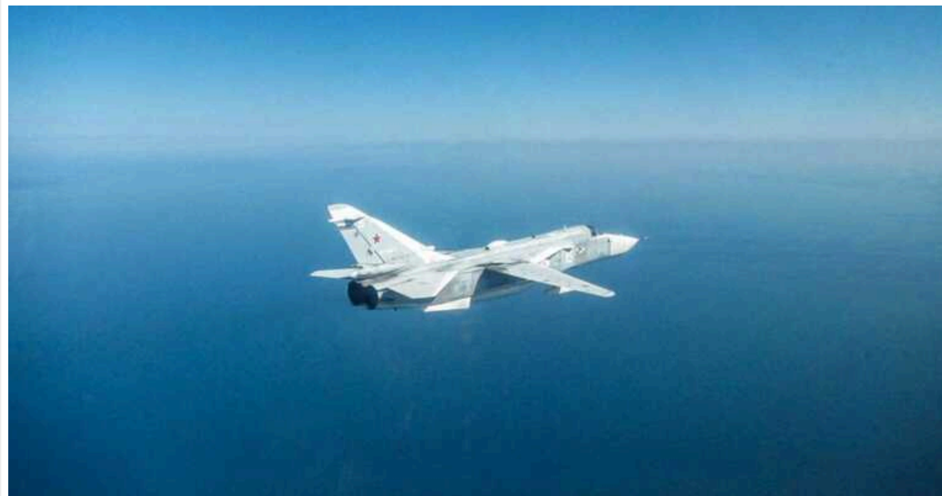
В ISW пояснили, як втрата Росією літаків вплинула на активність ворожої авіації в Україні

Нещодавні порівняно високі втрати Росією авіації в Україні, схоже, спричинили значне зниження її активності на східних напрямках фронту. Але водночас неясно, як довго триватиме цей "страх" російських льотчиків здійснювати нальоти на українські позиції та населені пункти.