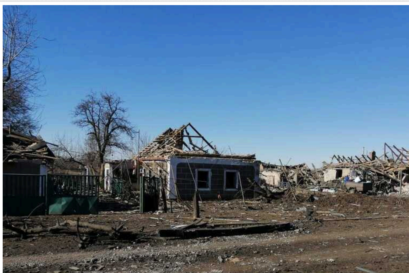
Війська РФ понад 170 разів били по Запорізькій області, – ОВА

У Запорізькій ОВА зазначили, що ворог вдарив авіаснарядом по Роботиному, також здійснив 10 РСЗВ-обстрілів Малинівки, Малої Токмачки та Роботиного, а також атакував 33 безпілотниками Гуляйполе, Новоданилівку, Малинівку, Малу Токмачку й Роботине.