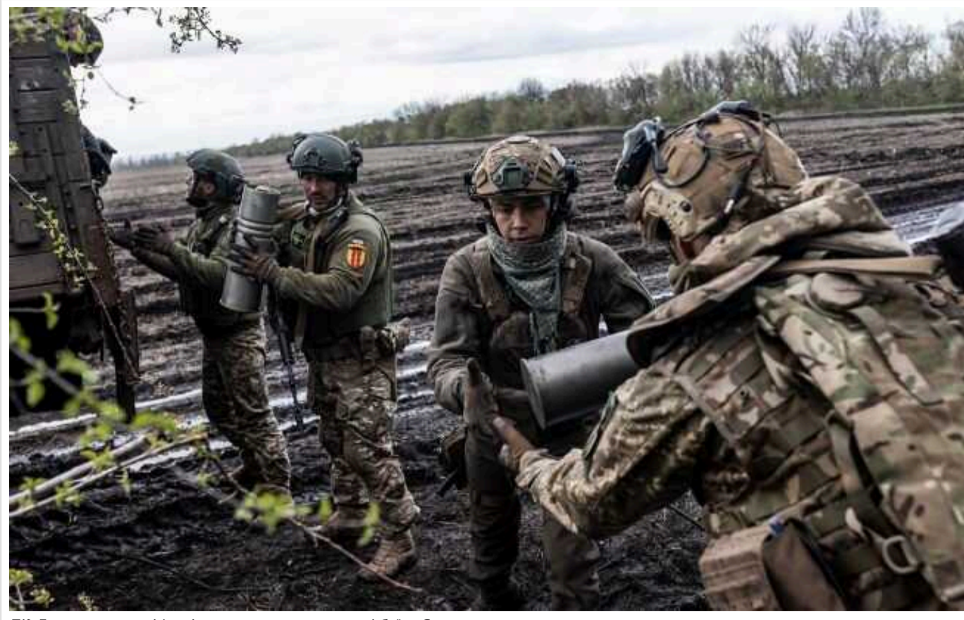
Під Бахмутом у селі Іванівське точаться жорсткі бої, – Євлаш

Спікер Східного угруповання військ Ілля Євлаш повідомив, що у селі Іванівське під Бахмутом точаться жорсткі бої.