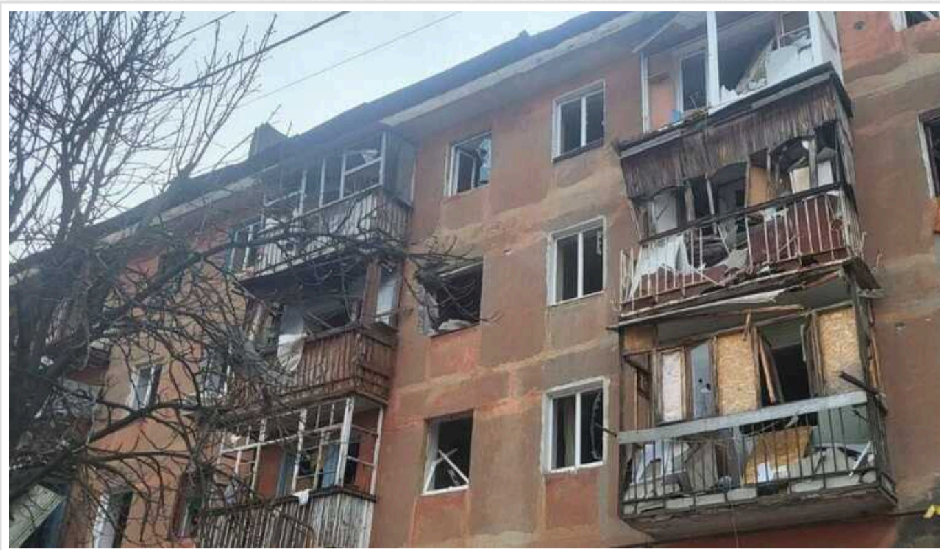
Окупанти скинули на Курахове КАБ-500: зруйновано багатоповерхівки, поранено 16 людей

Війська Росії вдень 3 березня скинули на житловий квартал у Кураховому Донецької області керовану авіабомбу КАБ-500. За попередньою інформацією, поранення дістали 16 осіб.