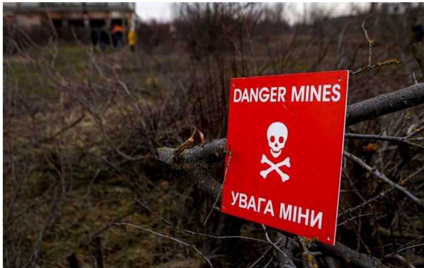
Україна підписала угоду щодо розмінування за допомогою штучного інтелекту, – Мінекономіки

За інформацією пресслужби Мінекономіки, згадане партнерство з компанією Palantir Technologies має допомогти швидше та дешевше розмінувати Україну.