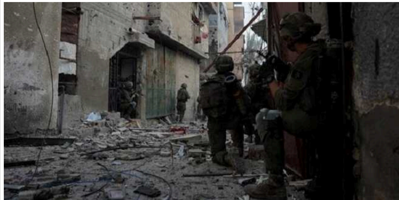
Припинення вогню в Секторі Гази не буде: ХАМАС зривав переговори

Бойовики ХАМАСу відмовились надати Ізраїлю список живих заручників. Ізраїльська делегація своєю чергою скасувала поїздку до Каїра на перемовини щодо припинення вогню на шість тижнів.