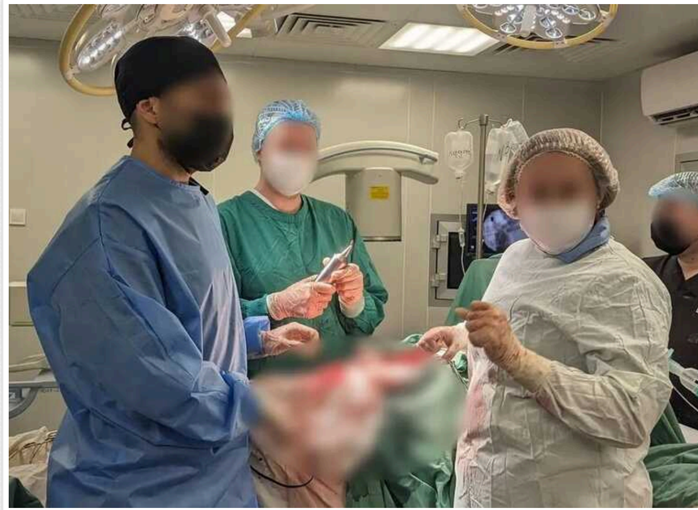
В Україні лікарі провели надскладну операцію, врятувавши воїнові життя

Українські лікарі виконали надскладну операцію та врятувати життя воїнові. Хірургам вдалося дістати уламок з задньої стінки аорти пацієнта.