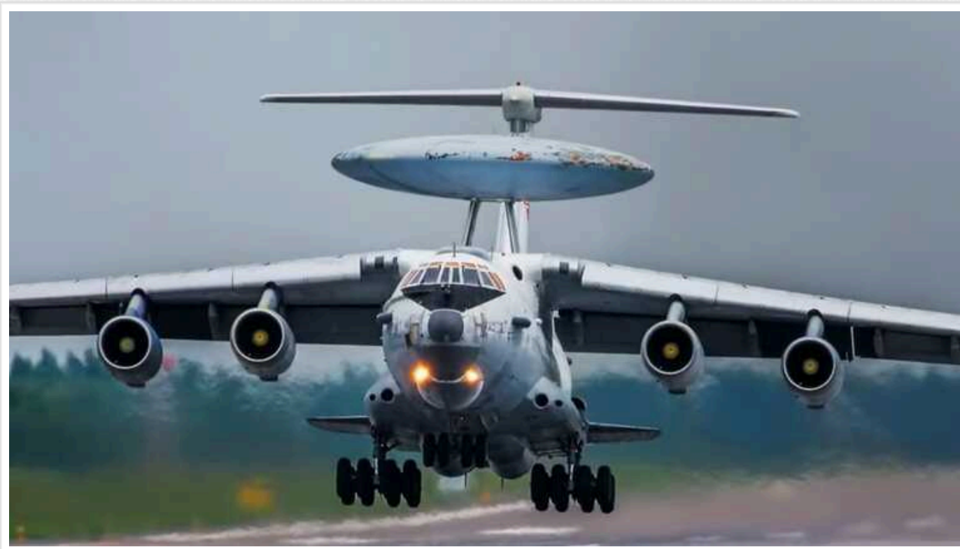
В ISW розповіли, в якому разі РФ готова жертвувати своїми літаками

Росіяни готові жертвувати літаками заради просування на Авдіївському напрямку.