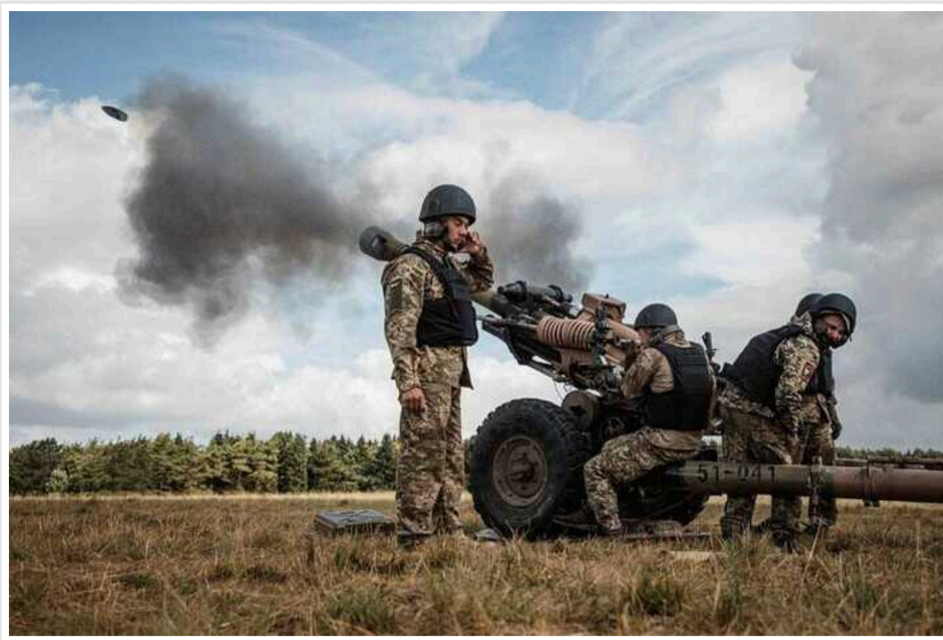
Міноборони Британії: Втрати РФ у війні перевищили сили, які було кинуту під час вторгнення в Україну

У Міністерстві оборони Великої Британії заявили, що за два роки повномасштабної агресії проти України Росія втратила більше, ніж складала її початкові сили, з якими вона розпочинала вторгнення. Так, загарбники позбулися вдвічі більшої кількості танків, ніж відправили в Україну у лютому 2022 року, і всіх БМП та БМ.