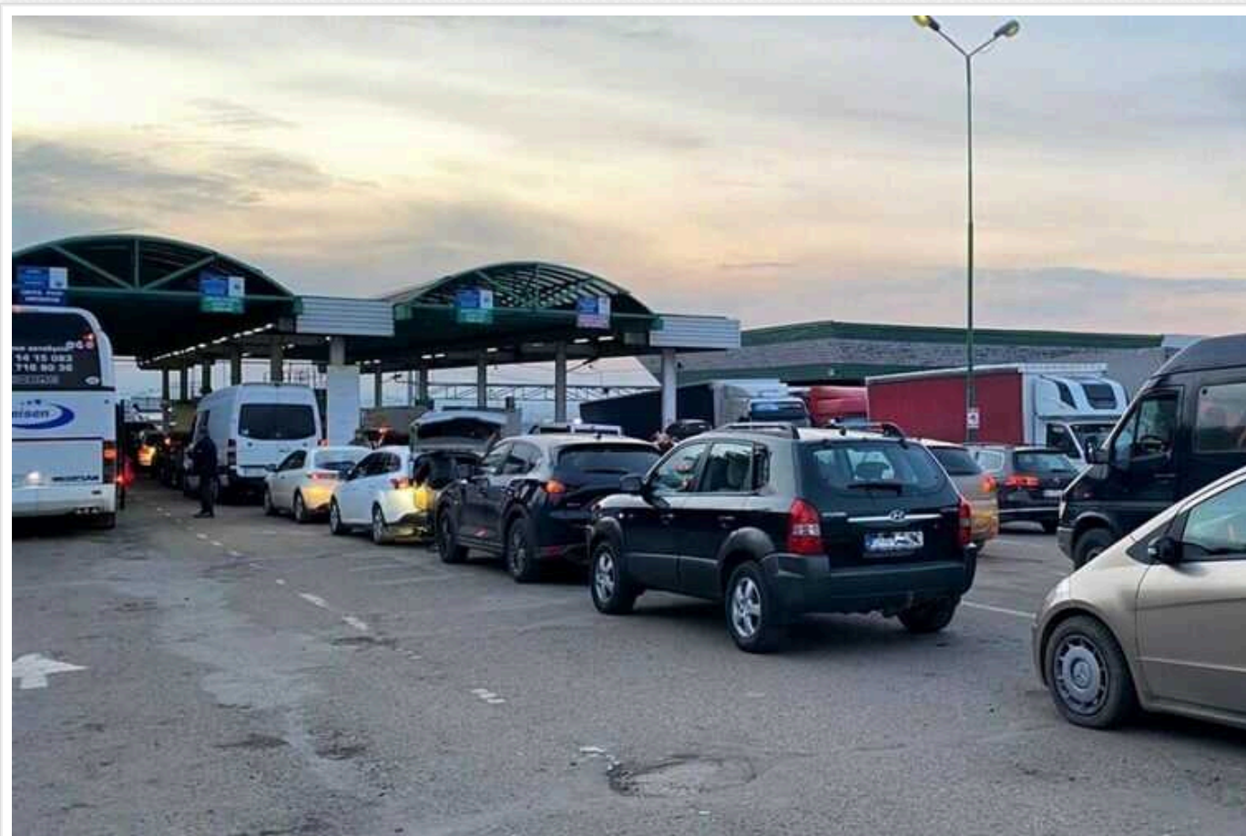
«Черга» відтепер стане доступною для водіїв легкових автоівок

Система електронної реєстрації "єЧерга" стане доступною і для водіїв легкових автомобілів. Раніше вона була націлена на спрощення процесу перетину кордону лише для вантажівок та пасажирських автобусів.