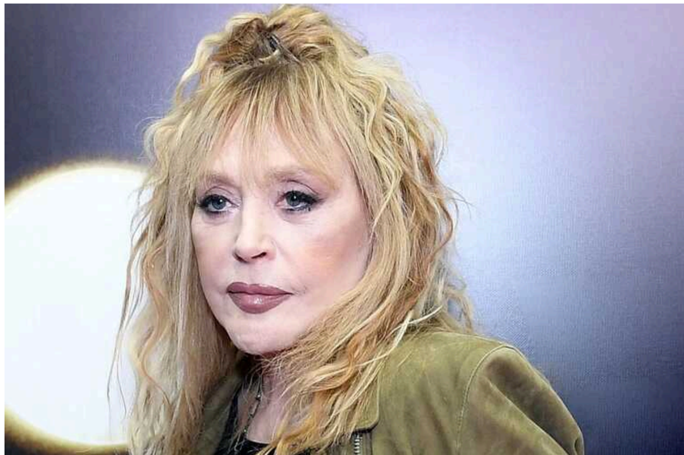
Алла Пугачова натяком на війну в Україні побажала прихильникам миру: "Не здавайтесь!"

Знаменита російська співачка Алла Пугачова, яка разом із чоловіком-іноагентом Максимом Галкіним та їхніми дітьми після повномасштабного вторгнення виїхала з РФ, вперше за довгий час звернулася до фанів. Примадонна закликала прихильників "не здаватися", що багато хто вкотре розумів як натяк зірки на її антивоєнну та антипутінську позицію.