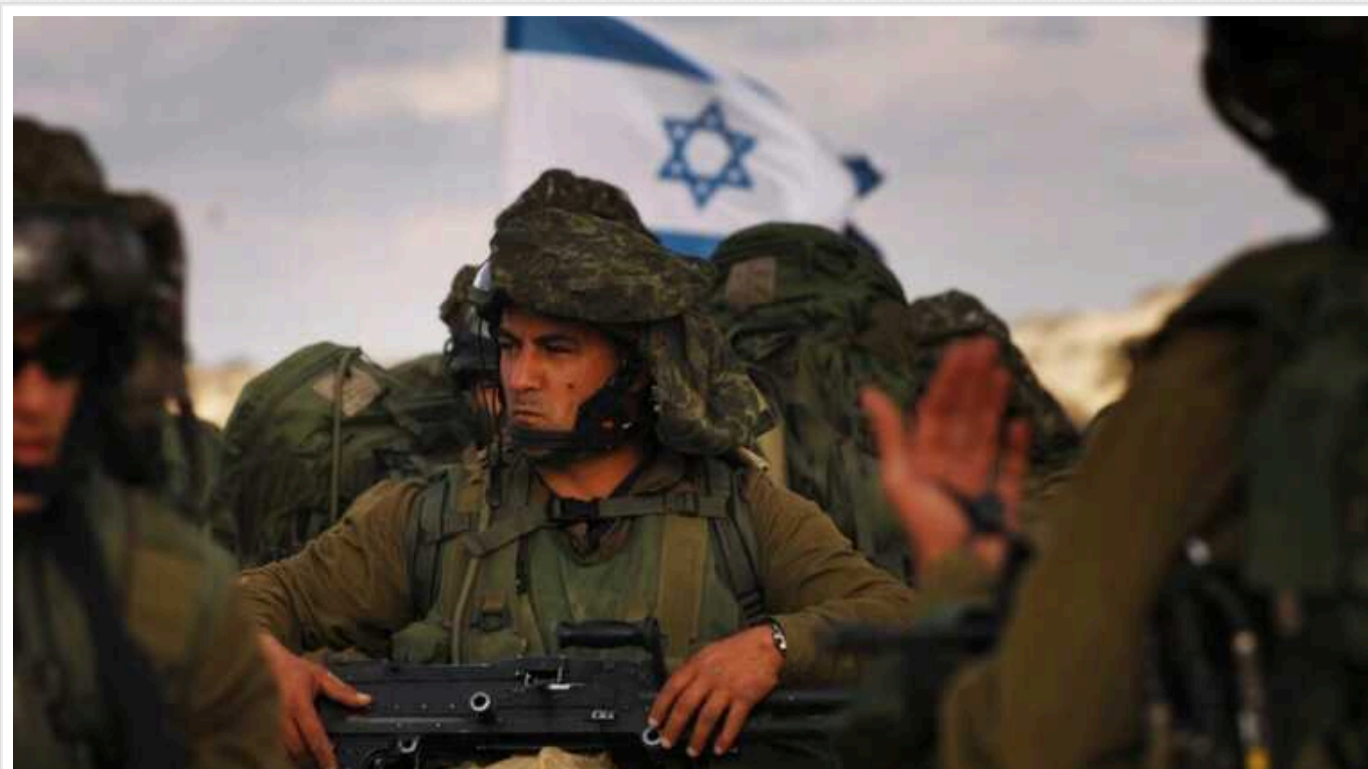
AFP: Ізраїль погодився на шеститижневе припинення вогню, ХАМАС має звільнити заручників

У суботу, 2 березня, Ізраїль прийняв угоду про шеститижневе припинення вогню у секторі Гази. Тепер терористична організація ХАМАС повинна погодитися звільнити частину заручників, щоб домовленість про тимчасове перемир'я набула чинності.