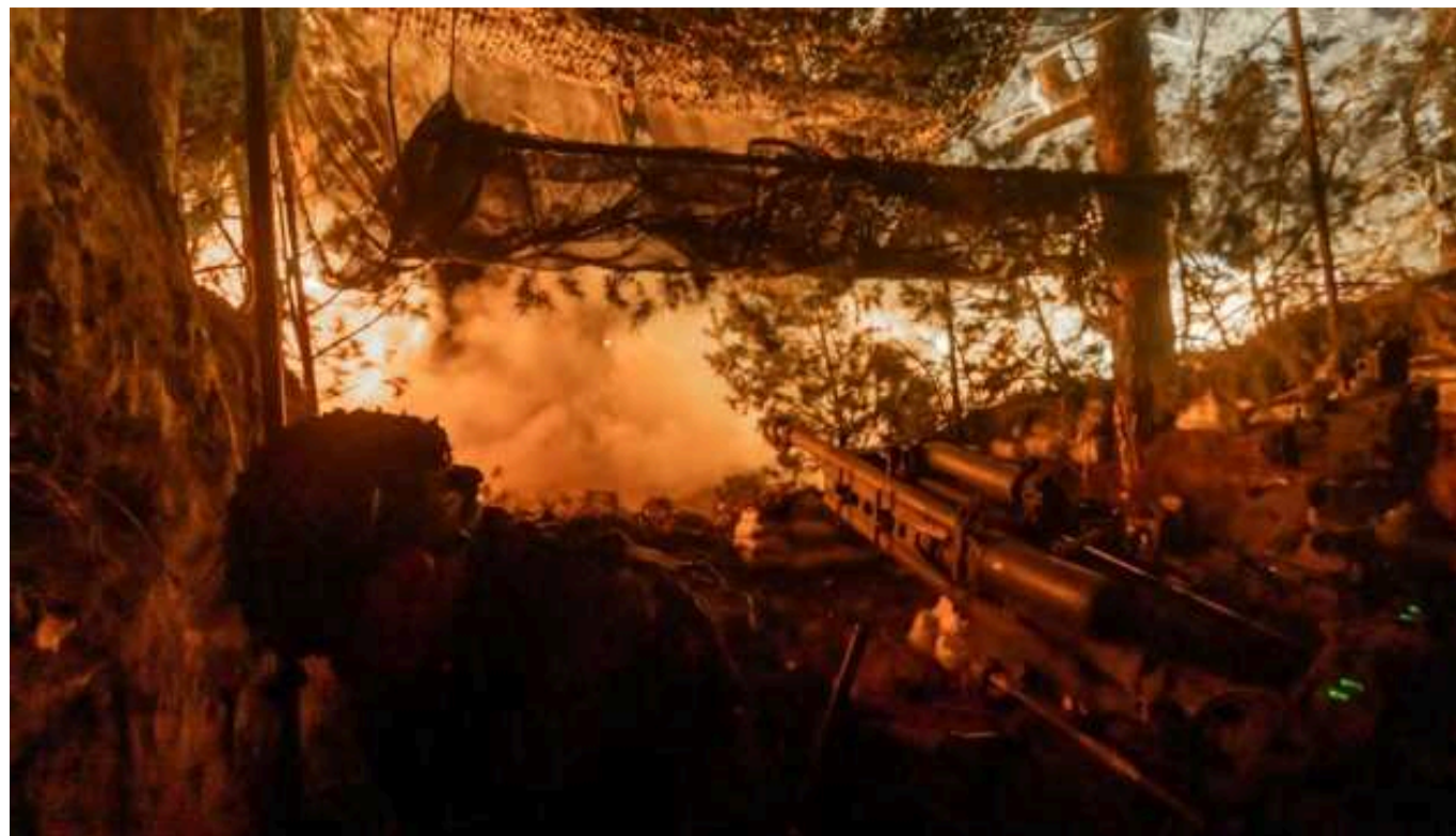
"Росіяни продовжують тиснути у районі Часового Яру та намагаються виявити слабе місце", - Євлаш

Російські війська у районі Часового Яру продовжують тиснути - за добу зафіксовано 15 бойових зіткнень.