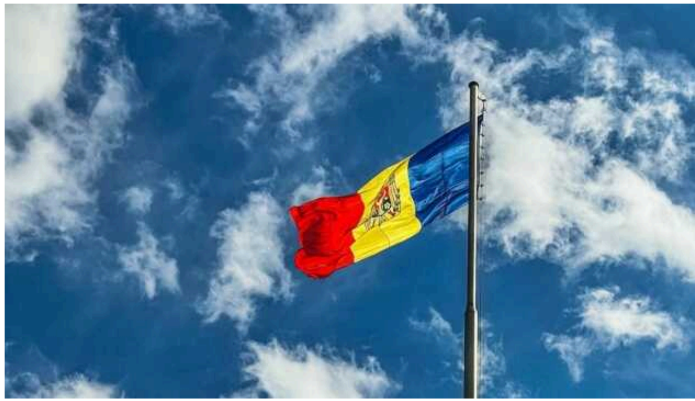
У Молдові відреагували на заяві Лаврова: РФ не має права читати лекції про демократію

Міністерство закордонних справ Молдови заявило, що Росія не має права читати лекції про демократію.