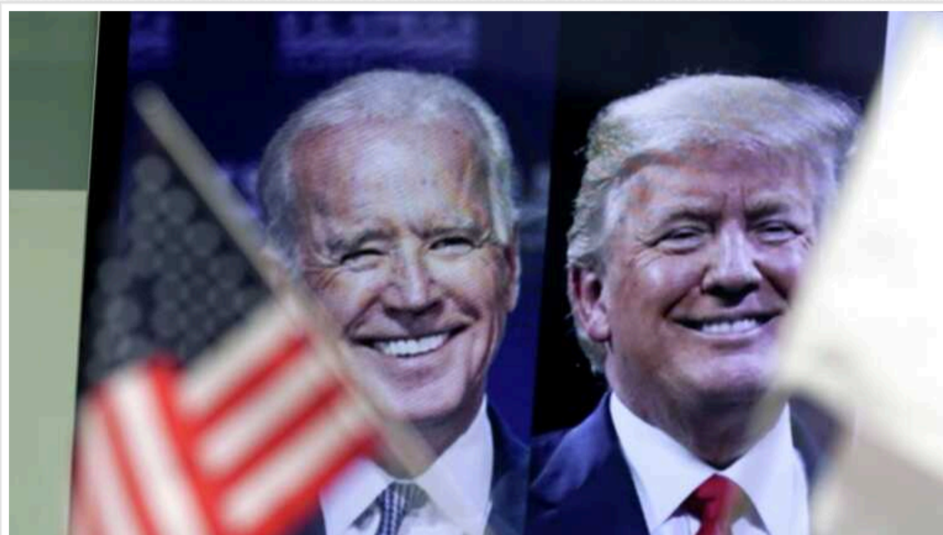
New York Times: Трамп випереджає Байдена у новому опитуванні

Експрезидент має 48% підтримки, нинішній 43%, причому Трамп збільшив відрив від Байдена майже вдвічі, порівняно з попереднім таким же дослідженням, яке проводив Сіенський коледж.