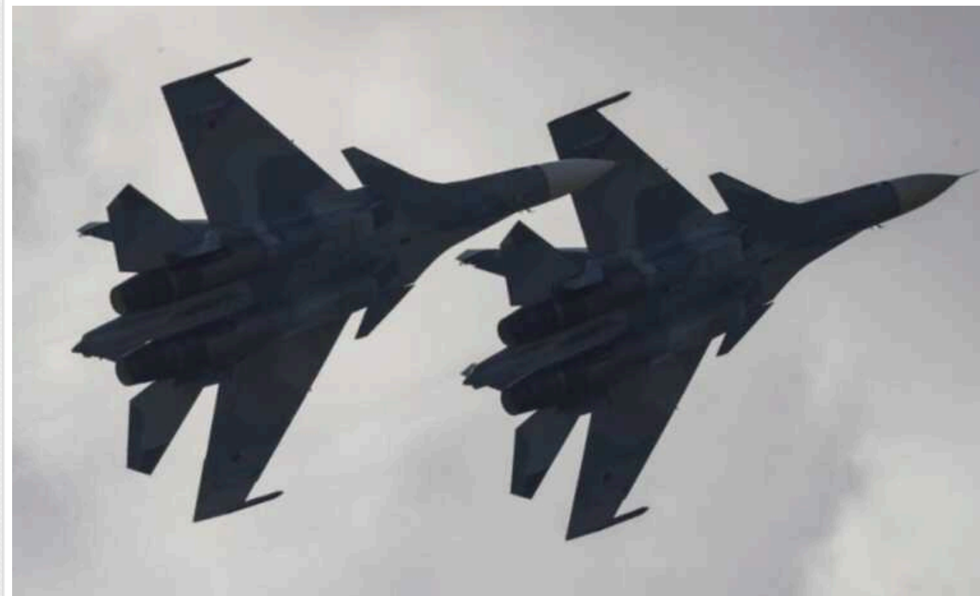
ISW: РФ готова втрачати літаки заради тактичного просування на фронті

У гонитві за хоч мінімальним тактичним просуванням на Авдіївському напрямку, армія РФ готова пожертвувати своїми літаками, пише Інститут вивчення війни (ISW).