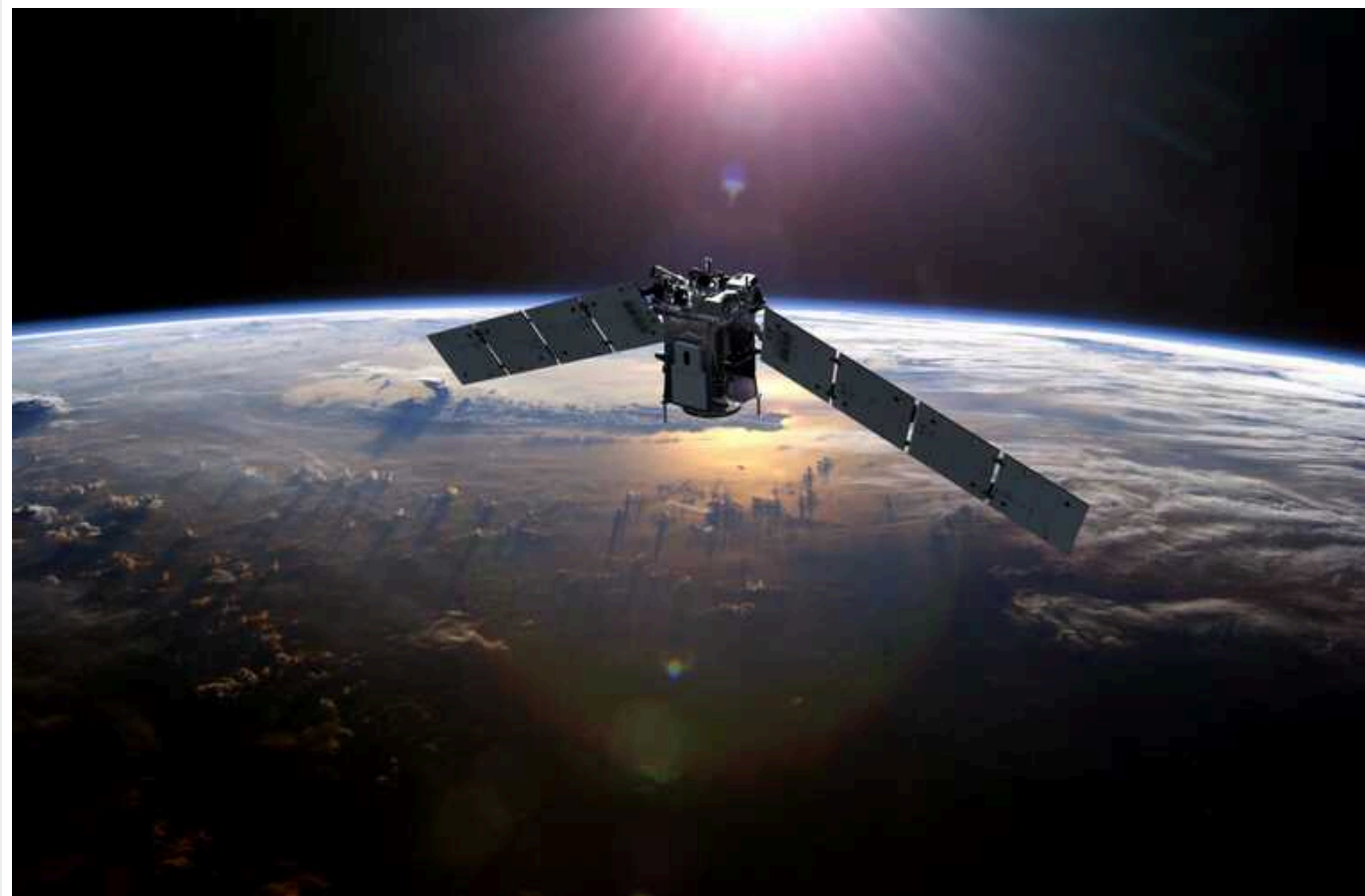
Розвідувальний супутник Південної Кореї передав перші зображення Пхеньяна

Військовий супутник-розвідник Південної Кореї, запущений у грудні, передав перші детальні зображення центру столиці КНДР Пхеньяна.