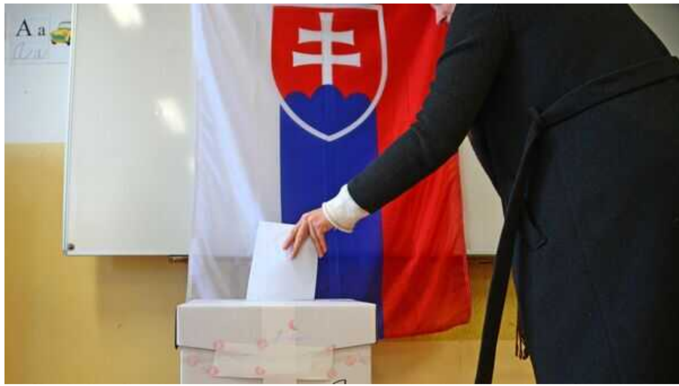
Президентські вибори у Словаччині: кандидат від опозиції перемагає у першому турі

Опитування прогнозують найвищі результати у першому турі майбутніх президентських виборах у Словаччині опозиційному кандидату Івану Корчоку.