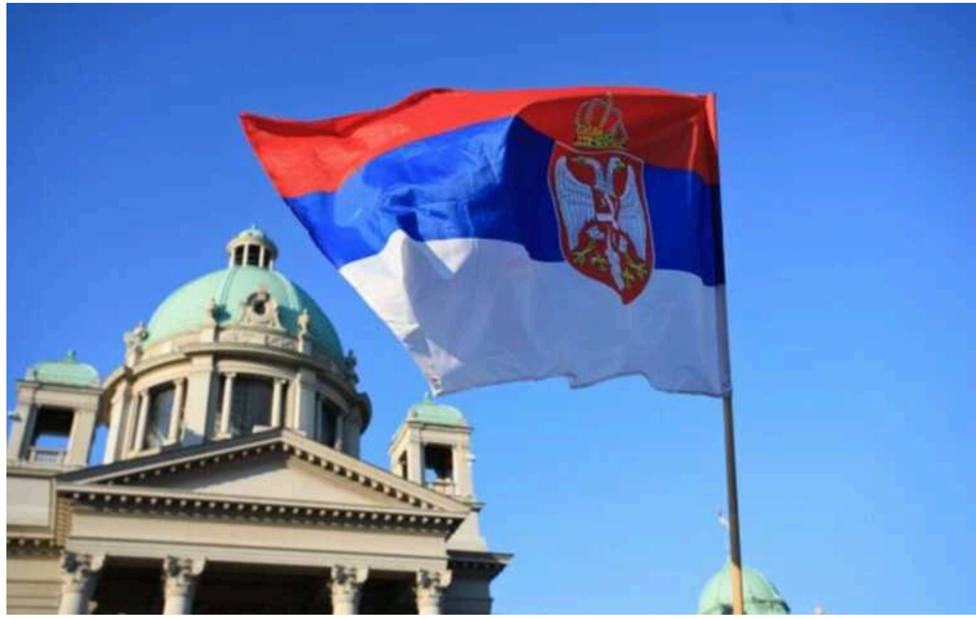
Сербія після звинувачень у фальсифікаціях проведе повторні вибори

Сербська влада оголосила про проведення повторного голосування на виборах у столиці Белграді на тлі звинувачень у фальсифікаціях.