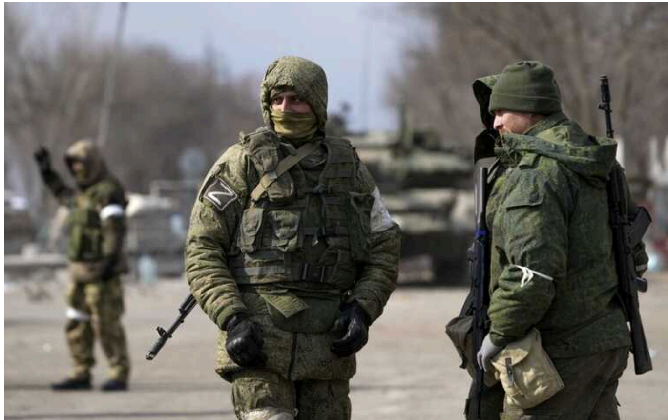
ЗС РФ перекидає основні підрозділи з напрямку Синьківки до Тернів, – Євлаш

На Лимано-Куп'янському напрямку росіяни зосереджують сили здебільшого поблизу Тернів, зменшивши інтенсивність наступів біля Синьківки.