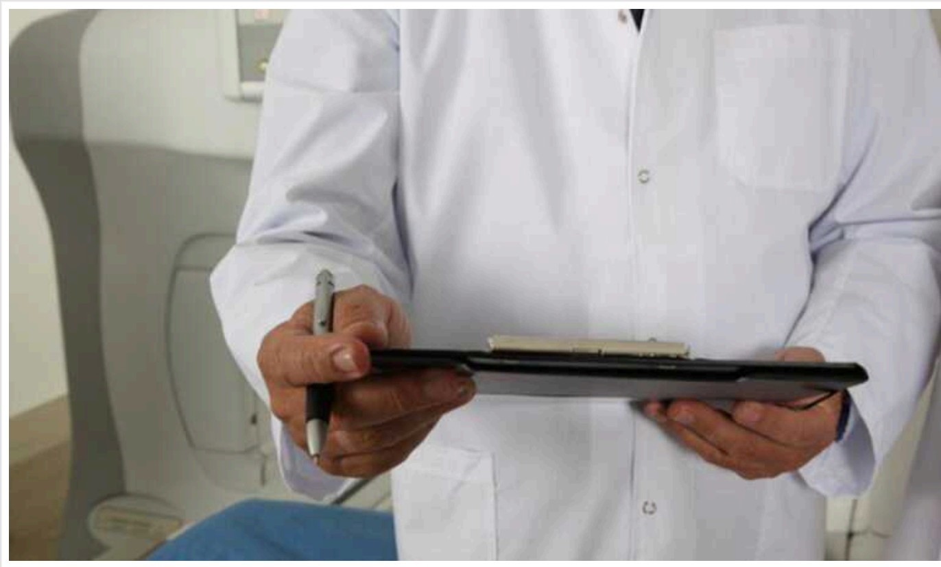
Окупанти закрили диспансери для українців, які не отримали паспорт РФ, - ЦНС

Окупанти закрили диспансери на тимчасово окупованій території для українців, повідомляє Центр національного спротиву.