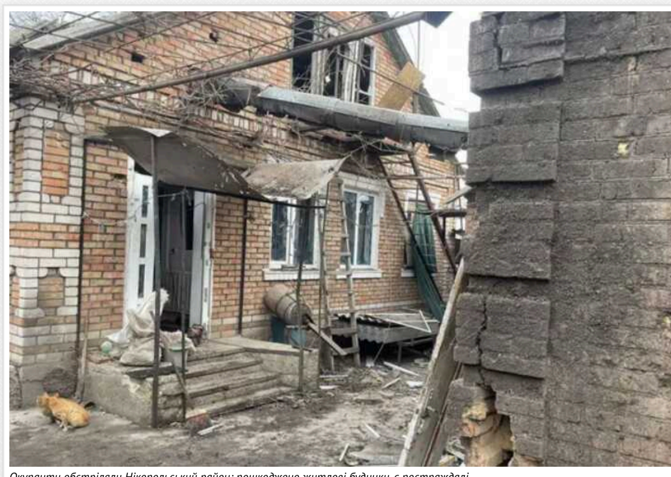
Окупанти обстріляли Нікопольський район: пошкоджено житлові будинки, є постраждалі

В суботу, 2 березня, окупант вдарив дронами та артилерією по Нікополю. Обстріли зазнали також Червоногирівська і Марганецька громади.