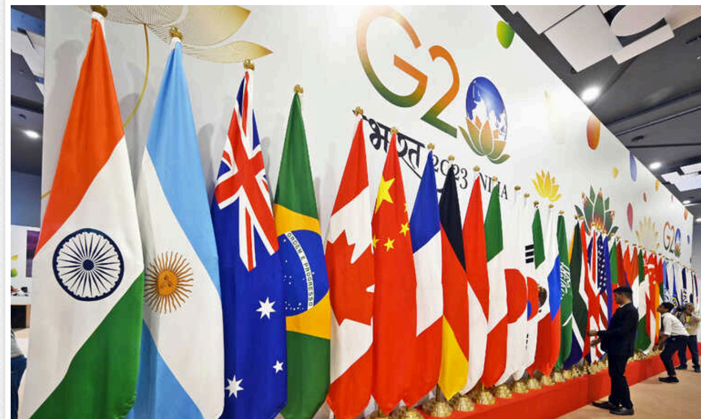
Reuters: Наступні зустрічі міністрів G20 можуть завершитися без спільних заяв через розбіжності щодо геополітичних питань

Нещодавня зустріч міністрів фінансів завершилася без комюніке на тлі розбіжностей щодо війни РФ проти України та ситуації в Секторі Гази.