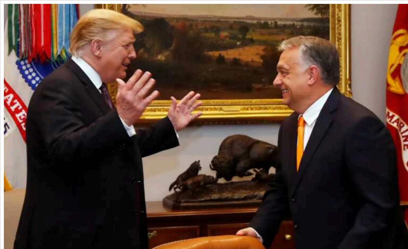
Прем'єр Угорщини Орбан вважає перемогу Трампа "єдиним шансом" на мир в Україні

Прем'єр-міністр Угорщини Віктор Орбан вчоргове заявив, що повернення Дональда Трампа у Білий дім нібито допоможе завершенню війни в Україні. Виступаючи на Анталійському дипломатичному форумі Орбан розповідав про переваги перемоги Трампа на майбутніх виборах президента США.